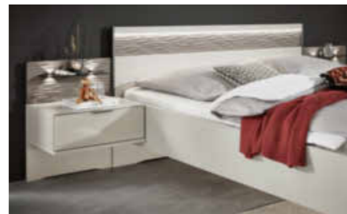
NACHTSCHRANK-PANEEL UND KOPFTEIL MIT WELLENSTRUKTUR