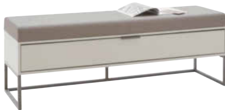
ANKLEIDEBANK MIT SCHUBKASTEN