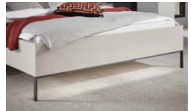
BETT MIT KUFENGESTELL UND FUSSTEILBELEUCHTUNG