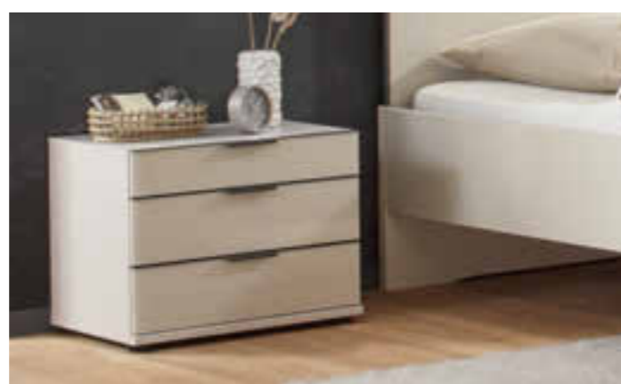
STAND-NACHTKOMMODE MIT 3 SCHUBKÄSTEN, GRIFFE WAHLWEISE IN CHROM ODER SCHIEFER