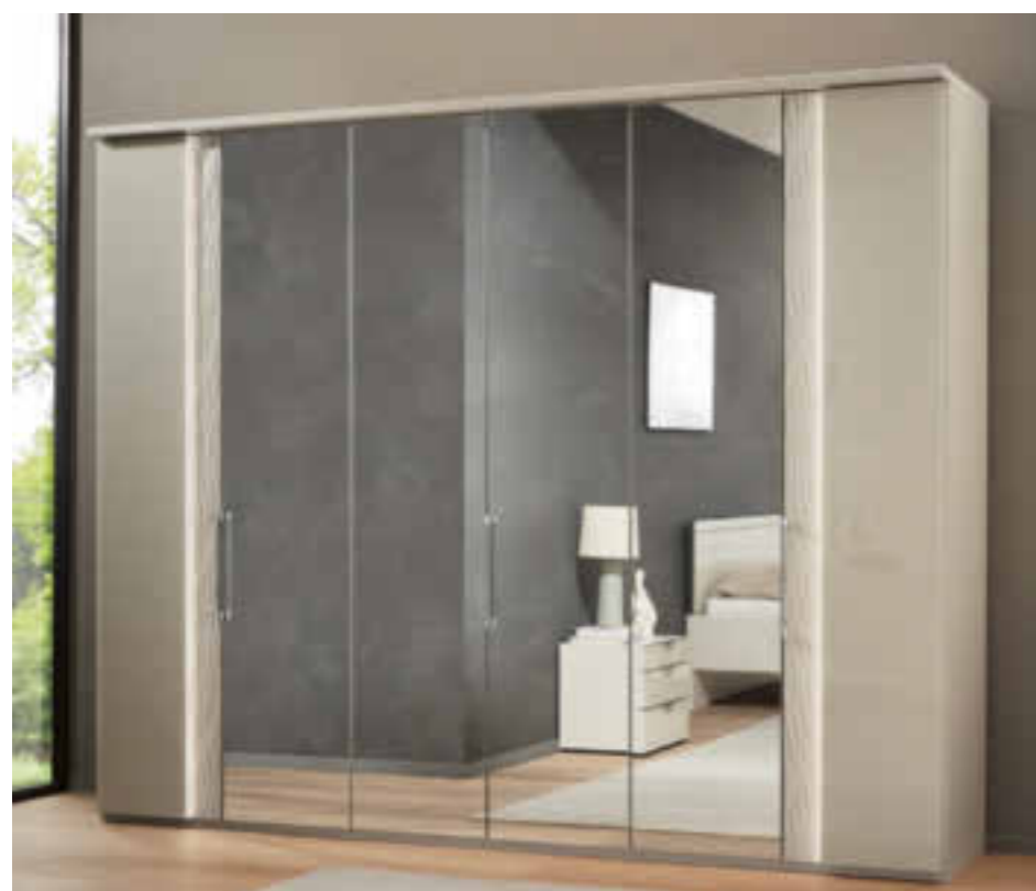
Drehtürenschränk mit 4 Spiegeltüren und Designaussentüren mit Aufleistungen in Wellenstruktur