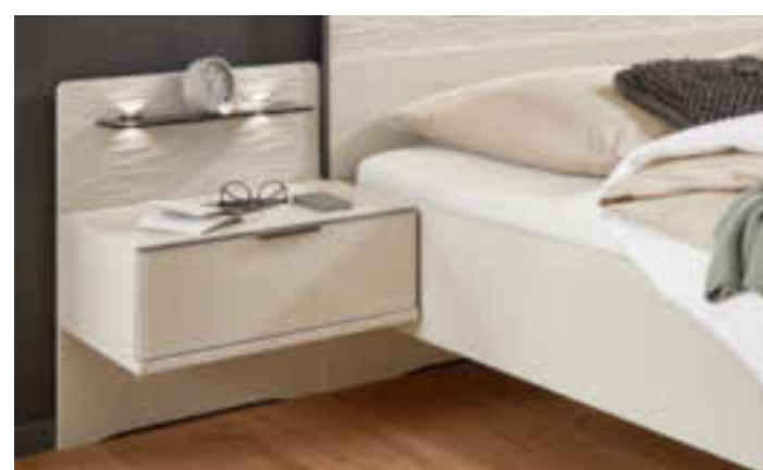
NACHTKÄSTCHEN MIT PANEEL IN WELLENSTRUKTUR UND RAUCHGLASBODEN MIT LED-BELEUCHTUNG

Fano bietet Ihnen alle Möglichkeiten, die hohen Ansprüche, die Sie an Ihr Schlafzimmerinterieur stellen, zu realisieren. Die große Auswahl an Drehtürenschränken, wahlweise mit Designaußentüren und Schwebetürenschränken, teilweise mit Synchronöffnung, schenken Ihnen zusammen mit Kommoden und Ankleidebänken ideale Aufbewahrungsplätze für Ihre Kleidung. Auch Betten -optional mit Großraumschubkästen- und Nachtkästchen gefallen mit Absetzungen in Wellenstruktur. Entdecken Sie auch, wie die innovativen und eleganten Beleuchtungsideen Ihren Schlafraum so besonders gestalten.